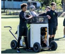
UNE MACHINE À LANCER LES BALLONS