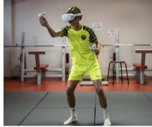
TRAVAIL COGNITIF avec le logiciel performind et des casques de réalité virtuelle