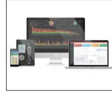
LOGICIEL SOCCER BI de suivi et d'optimisation de la performance