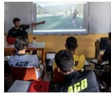
COURS D'ANALYSE des postures, au travers de vidéos d'entraînements