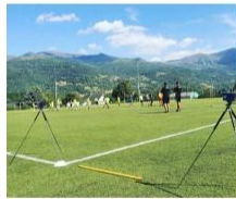
CELLULES PHOTOÉLECTRIQUES pour mesurer précisément la vitesse de déplacement